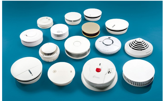
Abb.: Auswahl Rauchwarnmelder verschiedener Hersteller

Die Notstrom-Option gewährleistet eine einwandfreie Funktionsbereitschaft auch bei Stromausfall. Qualitativ hochwertige Melder arbeiten weitestgehend wartungsfrei.